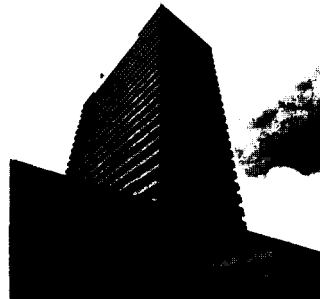
Den Haag The Hague La Haye