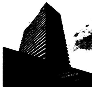
Den Haag The Hague La Haye

Die Besoldungsgruppen der Dienstposten entsprechen dem System der Koordinierten Organisationen. Die drei Amtssprachen sind Deutsch, Englisch und Französisch.